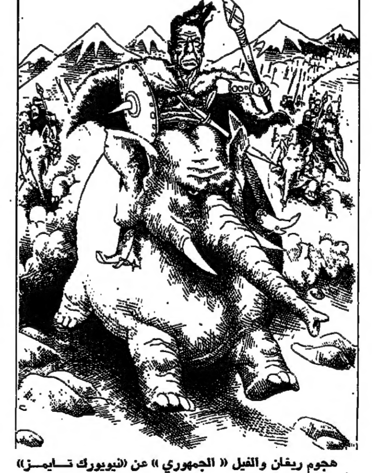
هجوم ريغان والقيل «الجمهوري» عن (نيويورك تايمز)

سيناميا. فغنى الكثير من المال. وادخر الكثير. الا ان احدا لا يعرف حقيقة وضع ريغان المالي. والسبب في ذلك يعود الى ان رونالد ريغان يحرص على الحرس على عدم مشاركة الآخرين بحياته الخاصة. وهو يفتخر بالخصوصية الخاصة. ويقول بان للمواطن الاميركي ان ينفخر بنظامه الديمقراطي وبالحرية التي ينعم بها. وبالتالي فان تلك الحرية تفرس منح كل انسان الحق في المحافظة على حياة خاصة بعيدة عن الاضواء. ويصير ريغان مليونيرا اميركا. وتقدر الاوساط المالية ثروته ما بين الـ ١٠٠ مليون والاربعه ملايين دولار الا انه يصعب تحديد هذه الثروة الشخصية نتيجة رفض ريغان رفضا قاطعا السماح لاية جهة بالبحث بسا ويعبرها شؤونه الخاصة. ويعتدل ريغان من حيث «اللباس الابيض».